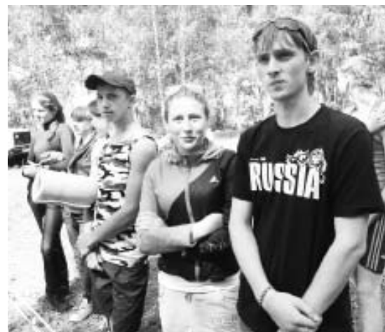
СЕРЕБРЯНЫЕ ПРИЗЕРЫ ТУРСЛЕТА - КОМАНДА «ФАКЕЛЬ».

Председатель первичной профсоюзной организации.